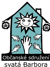
Občanské sdružení svatá Barbora